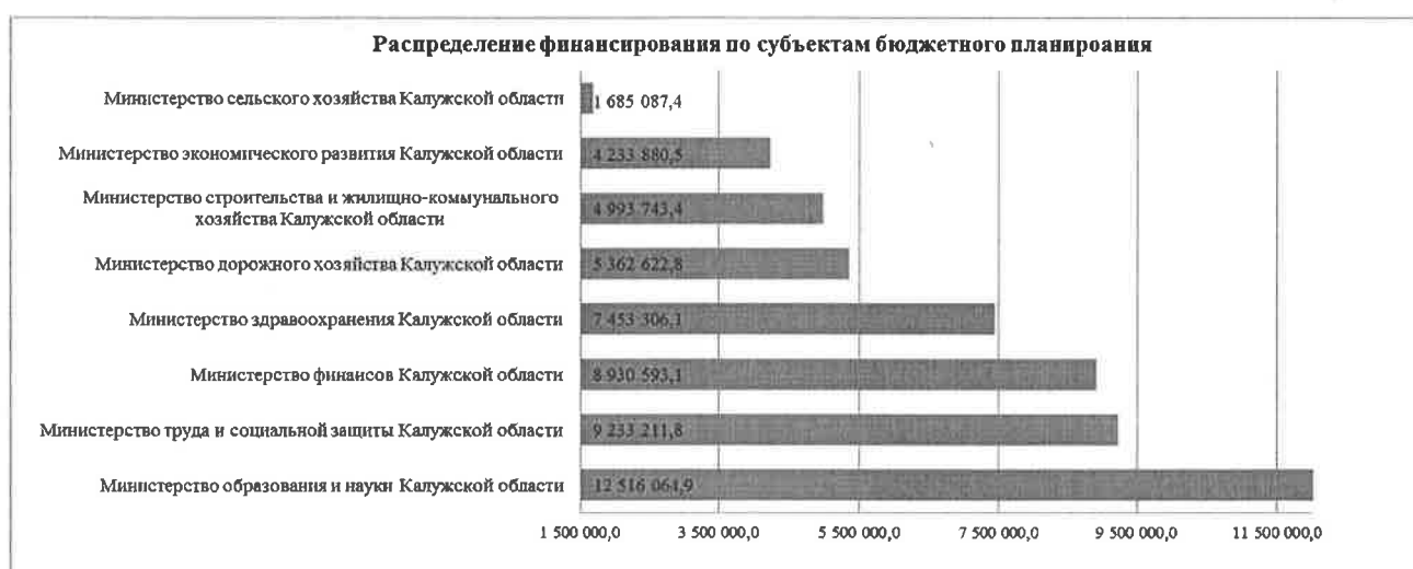
Диаграмма 3 (тыс. руб.)

5.4. Структура расходов областного бюджета на 2019-2021 годы по разделам классификации расходов бюджетов представлена в таблицах 5 и 6.